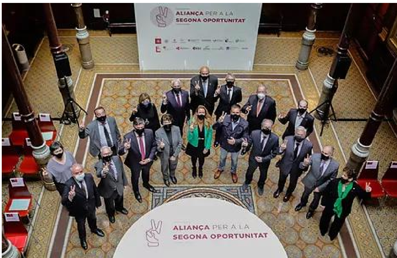
Representantes de las entidades profesionales

Recuerdan que para paliar un endeudamiento se puede llegar a un acuerdo extrajudicial con los acreedores