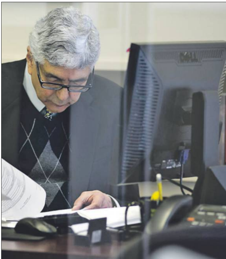
Els auditors estan molt descontents amb el projecte de llei